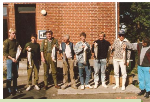
Et kanon-år på Ærø ved septemberkonkurrencen ultimo 1980'erne – primo 1990'erne.