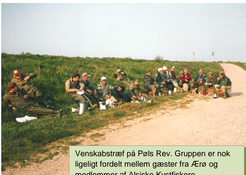
Venskabstræf på Pøls Rev. Gruppen er nok ligeligt fordelt mellem gæster fra Ærø og medlemmer af Alsiske Kystfiskere. Efter 1990.