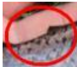
Store og små smolt på udsætningstidspunktet.